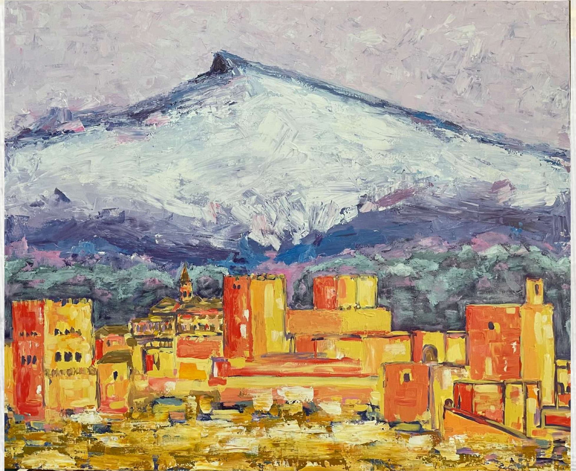
“El último baluarte del agua”

“Donde el cielo tocó la tierra, Granada” también es heredera de una tradición que se deforma en perspectivas fingidas y fantásticas que pretenden emocionar al espectador que la contempla.